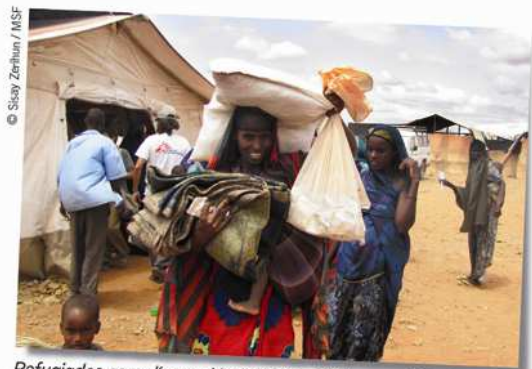
Refugiados somalíes recién llegados a Liben, en Etiopía, reciben sus primeras raciones de comida.

Los cuatro campos de refugiados de Liben, la zona desde donde te escribo, están abarrotados. Se diseñaron para acoger a 45.000 personas, pero hay más de 100.000. En Dadaab, Kenia, la situación es más crítica: casi 400.000 personas se hacinan en unos campos preparados para 90.000. Los riesgos de epidemias son evidentes. Y el flujo de refugiados no se detiene.