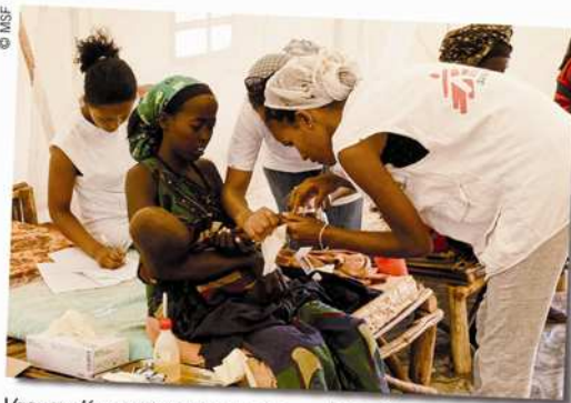
Vacunación contra el sarampión en Dolo Ado, uno de los cuatro campos de refugiados en Liben, Etiopía.

Lamentablemente, todo apunta a que esta crisis no se resolverá en unas semanas. Por eso me atrevo a pedirte una cosa más: por favor, si puedes, ayúdanos a difundir esta situación.