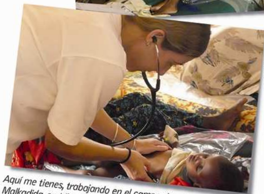
Aquí me tienes, trabajando en el campo de refugiados de Malkadida, en Liben.