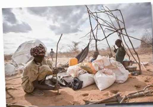
Los campos de refugiados de Dadaab, Kenia, están saturados. Muchos recién llegados construyen sus cabañas en el desierto de los alrededores.