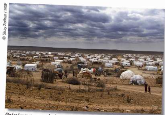
Bokolmayo, uno de los cuatro campos de refugiados en Liben, Etiopía.